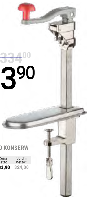
OTWIERACZ DO KONSERW