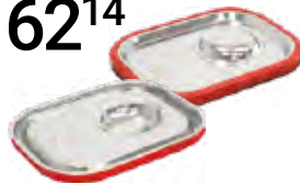
POKRYWA SZCZELNA, STANDARD