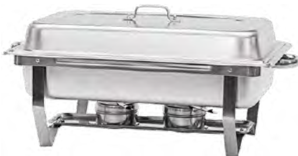
PODGRZEWACZ GN 1/1