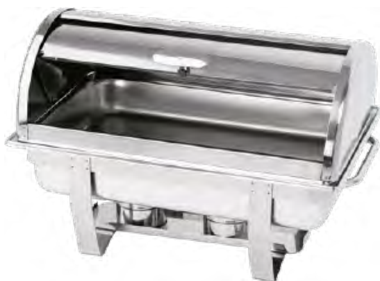
PODGRZEWACZ ROLL-TOP GN 1/1