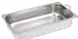
POJEMNIK GN 1/1, BASIC