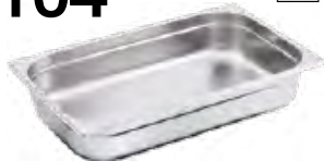
POJEMNIK GN 1/1, STANDARD