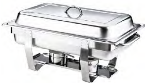
PODGRZEWACZ GN 1/1